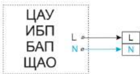
Рис. №2 Габаритный чертёж.